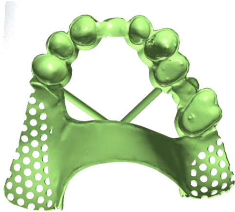
MOG + EH (2 Kronen = 1 EH) Gilt auch für Sublingualbügel mit Tertiärkronen